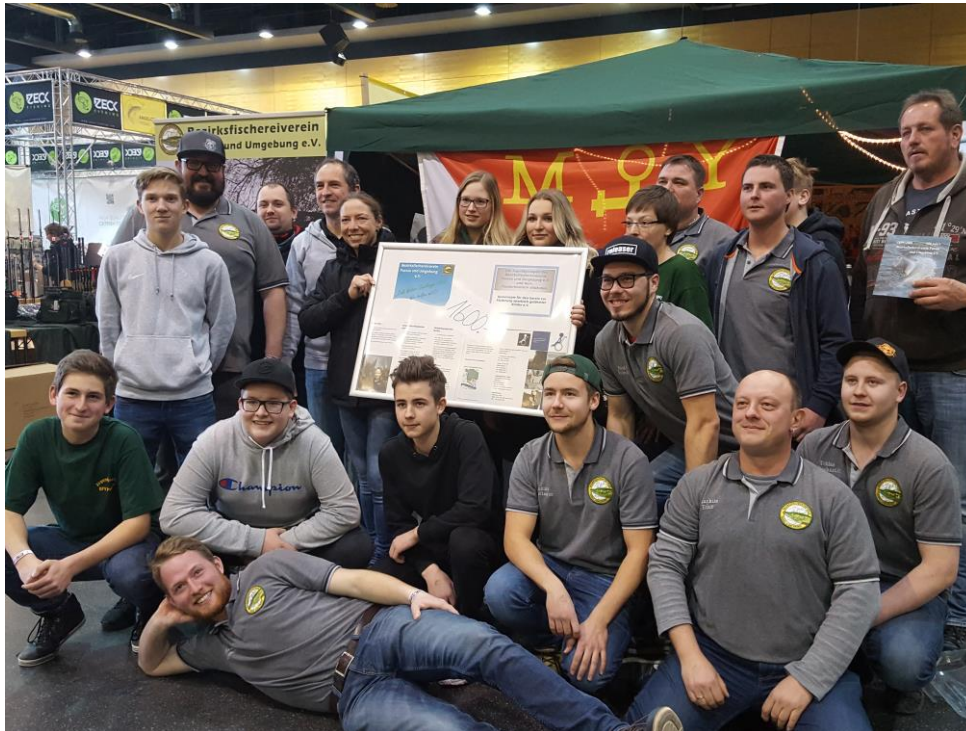
1600 Euro übergaben die Jugendgruppe des Bezirksfischereiverein Passau, die Jugendgruppe des Bezirksfischereivereins Vilshofen und der Motoryacht Club Passau an den Verein zur Förderung spastisch gelähmter Kinder.

Die Anglermesse zog wieder Petrijünger aus Bayern und Österreich an