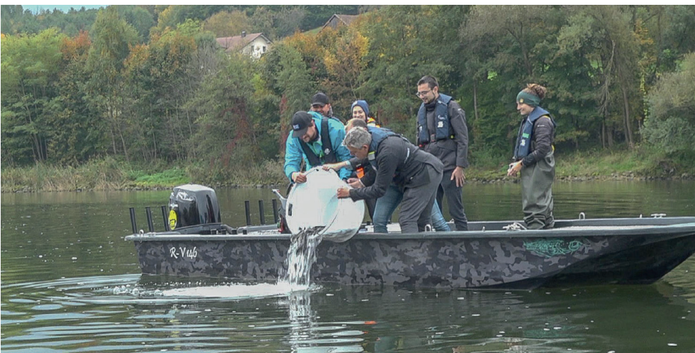
Knapp 1000 einjährige Sterlets werden bei Windorf in die Donau entlassen.

Für den Besatztermin fanden sich Vertreter aus dem Landwirtschaftsministerium, dem Bezirk, den Fischereiverbänden, des Marktes Windorf und der Wasser- und Schifffahrtsverwaltung des Bundes ein. Es ist geplant, das Besatzprogramm bis 2027 fortzuführen. Darüber hinaus beteiligt sich der Bezirk Niederbayern als Partner an einem INTERREG-Projekt zum Schutz und der Wiederansiedlung der vier heimischen Donaustörarten. Das Projekt mit dem Namen „MonStur“ möchte über Informationsaustausch der Akteure über Staatsgrenzen hinweg sowie ganz konkrete Projekte zur Stärkung bzw. Wiederansiedlung in der Donau beitragen. Unter anderem wird versucht, die Laichplätze der Sterlets in Jochenstein zu entdecken.