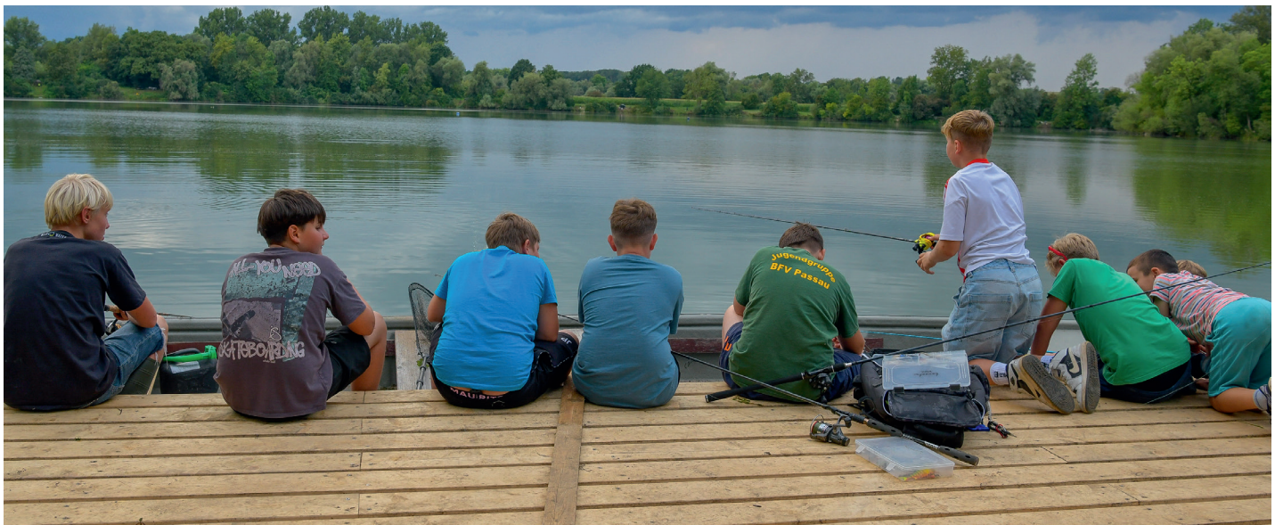
Die Jugend am vereinseigenen Wehrhauser Baggersee.

Nach dieser logistischen Meisterleistung konnten die Jugendlichen pünktlich zum Ferienstart am See begrüßt werden.