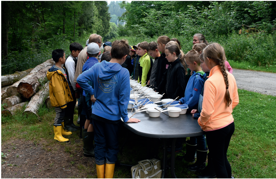
Das Projekt „Fischer machen Schule“ soll Grundschüler an das Thema Gewässer heranführen.

Das Jahr 2025 war für unsere Jugendgruppe wieder ein voller Erfolg. Neben Freude und Spaß am besten Hobby der Welt, standen wie immer die Ausbildung und der waidgerechte Umgang mit unseren Fischarten sowie vor allem Spaß im Vordergrund. Insgesamt wurden unseren Nachwuchsfischern zahlreiche Veranstaltungen angeboten, welche neben dem theoretischen Hintergrund auch die Praxis nicht zu kurz kommen ließen.