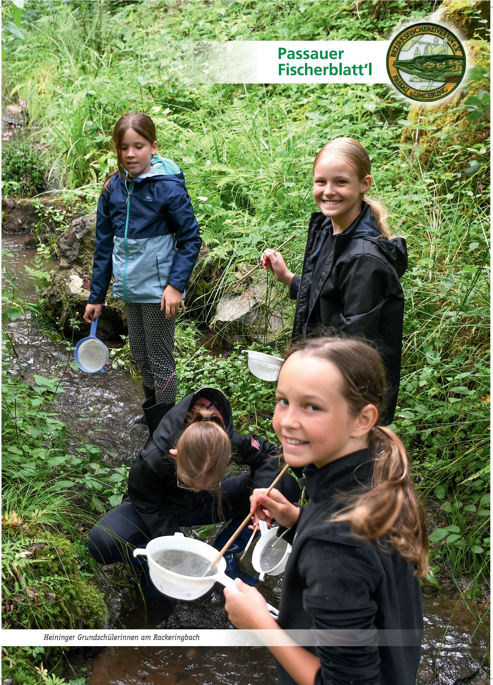
Heininger Grundschülerinnen am Rackeringbach