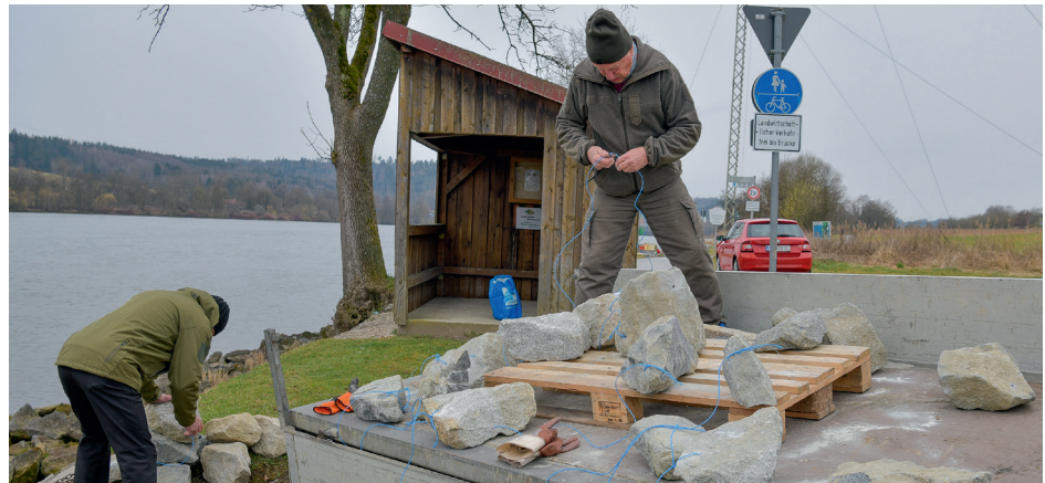
Mit Steinen werden die „Nester“ beschwert ...