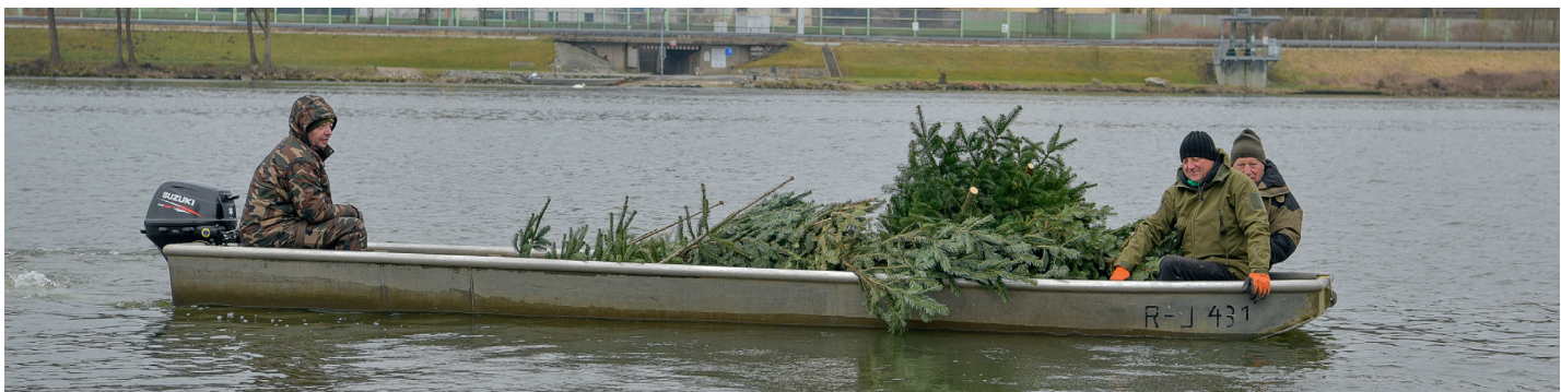
... und dann vom Boot aus in der Donau versenkt.